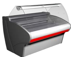
VXC Carboma Динамика