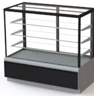
VXCB Carboma Cube (Люкс) Техно