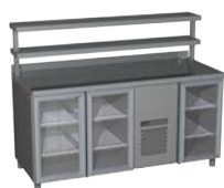
Carboma (Полюс) 3GNG/NT с надстройкой