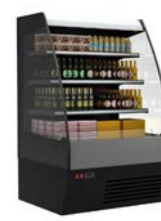
VXCP Carboma 1600

Пристенные холодильные витрины – идеальное предложение для магазинов любого формата. Они позволяют эффективно использовать торговое пространство благодаря компактным внешним размерам. Модели VXCP Carboma Cube и VXCP Carboma 1260 обеспечат активные продажи, привлекая покупателей современным дизайном.