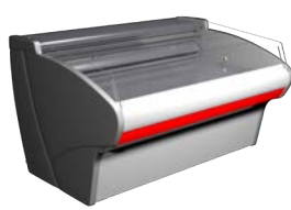
VXCL Carboma рыба на льду