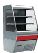
VXCP Carboma 1260