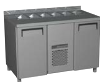
Carboma (Полюс) SL 2GN