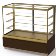
VXCB Carboma Cube (Люкс)