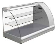
VXC Argo XL