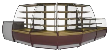
VXCB Carboma (Люкс), Mini, прилавок кассовый