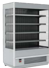
VXCP Carboma Cube