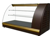
VXC Argo XL Lux

Барные витрины Carboma предназначены для кратковременного хранения, презентации и продажи суши, бутербродов, мяса, птицы, салатов, десертов, в магазинах, кафе, барах, ресторанах.