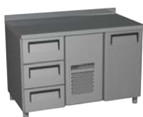
Carboma (Полюс) 2GN/NT(LT) 31

Охлаждаемые столы Carboma и Полюс предназначены для использования в гастрономических отделах торговых павильонов, столовых, кафе, баров, ресторанов. Столы позволяют рационально использовать площадь помещения, являясь комбинацией рабочего стола и холодильного шкафа.